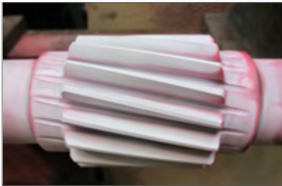
Contrôle par ressuage